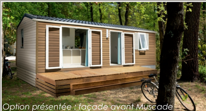
Option présentée : façade avant Muscade