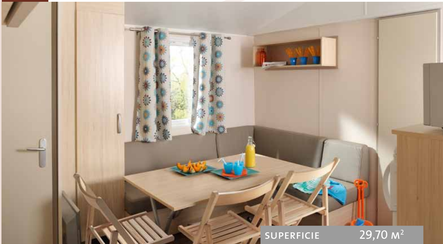
Ambiance présentée : FARNIENTE, rideaux Gipsy, assise Taupe.