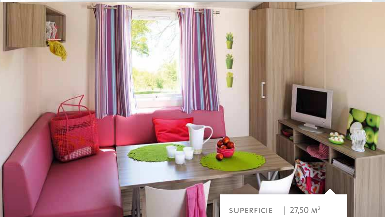
Ambiance présentée : ALLEGRO, rideaux Rayures Turquoise/Violet, assise Glycine.